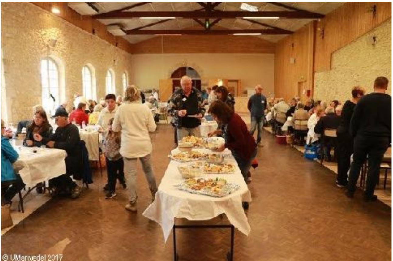
Das in der Mitte des Saales aufgebaute reichhaltige Buffet