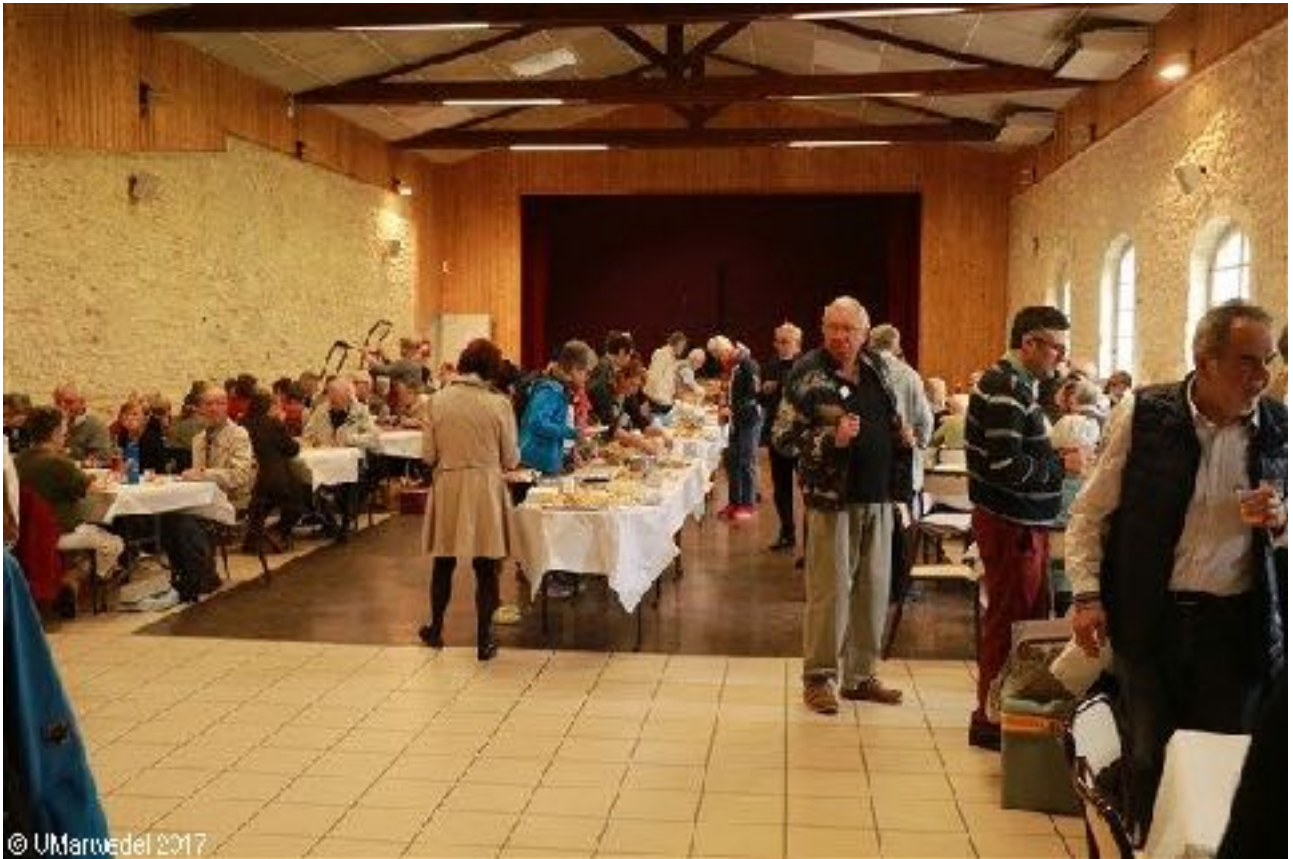
Der eigentliche Ort des Picknicks. Wegen des wetterbedingten Plan B im Kapitelsaal